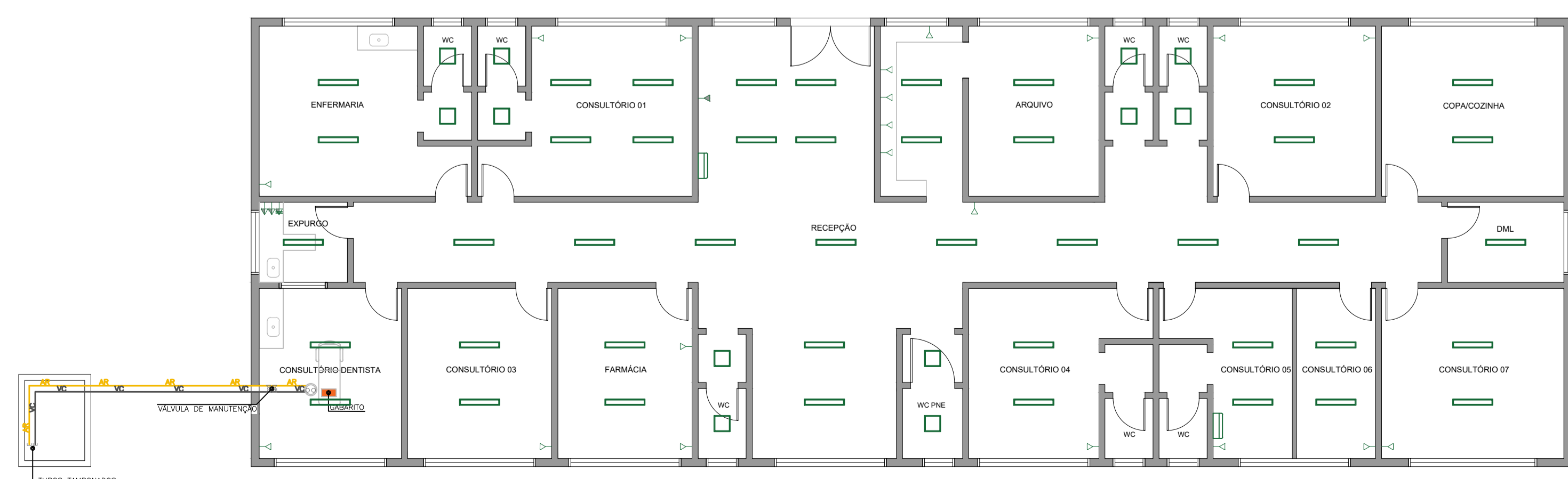
4 PLANTA BAIXA - LUMINOTÉCNICO E LOCAÇÃO DE PONTOS ELÉTRICOS ESCALA 1/100