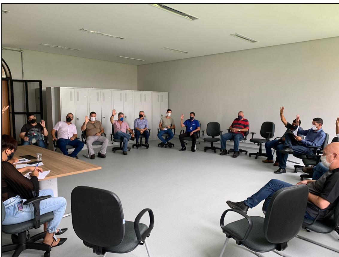
Figura 1 - Registro da Reunião Ordinária do COMDEMA de 31 de janeiro de 2022.