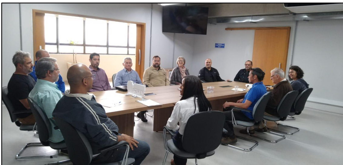
Figura 8 - Registro da Reunião Ordinária do COMDEMA de 29 de agosto de 2022.