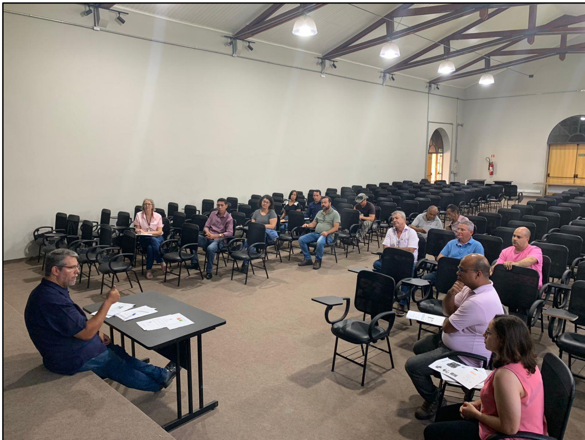
Figura 10 - Registro da Reunião Ordinária do COMDEMA de 31 de outubro de 2022.