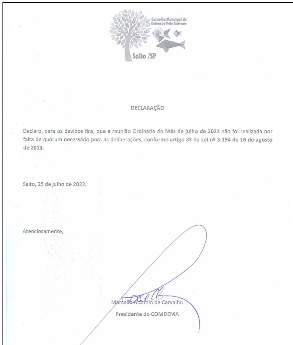
Figura 7 - Declaração do COMDEMA indicando que não houve reunião no mês de julho por falta de quórum.

Não houve reunião do COMDEMA em julho por falta de quórum, conforme declaração a baixo.