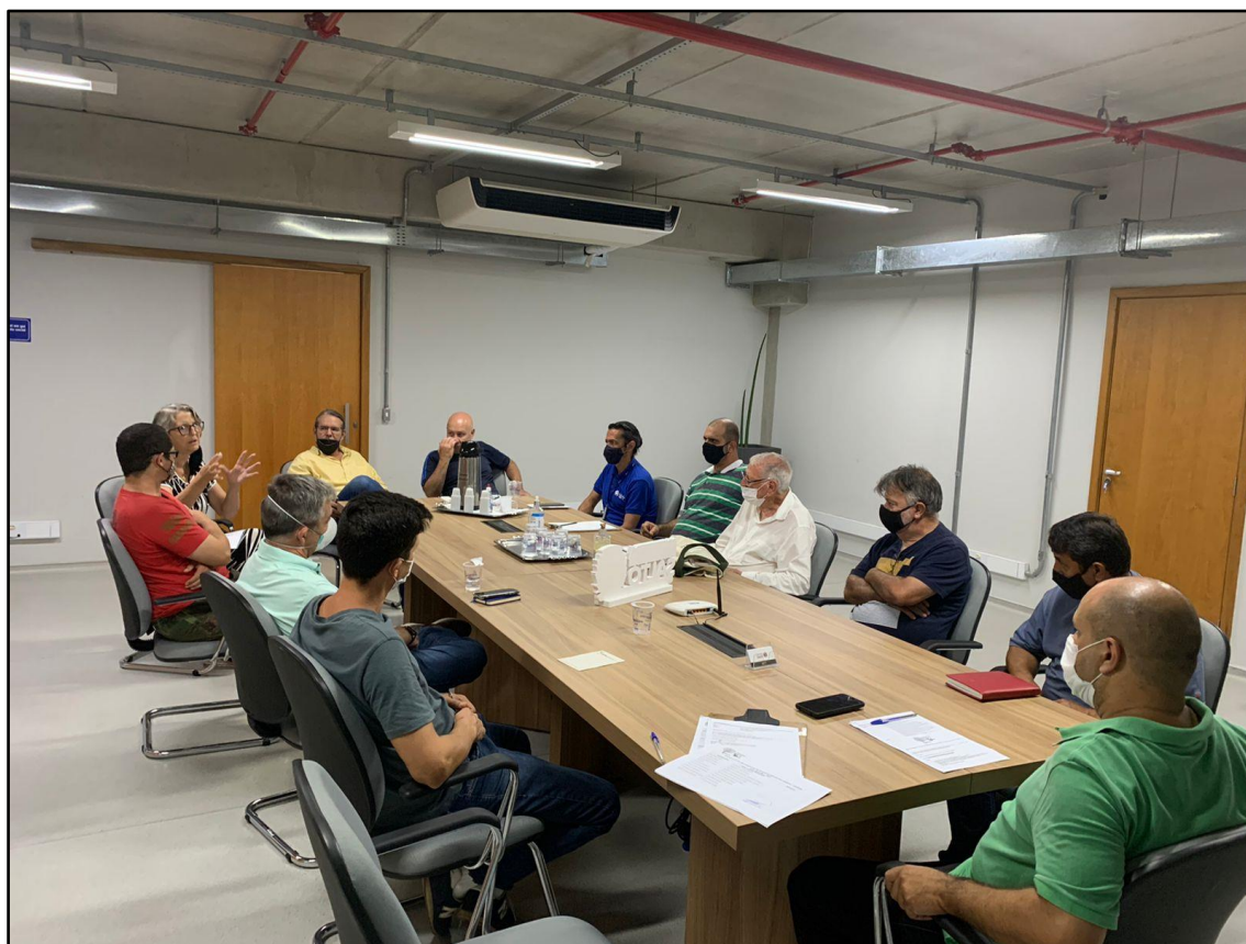
Figura 2 - Registro da Reunião Ordinária do COMDEMA de 21 de fevereiro de 2022.