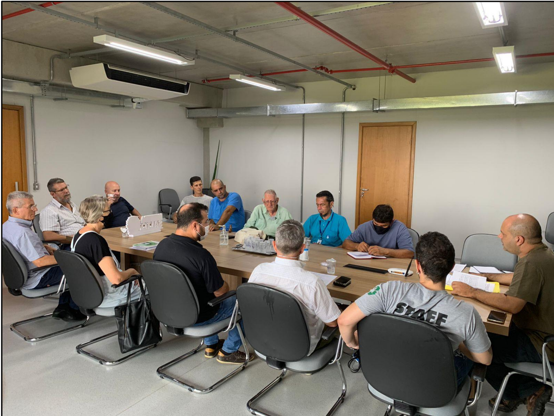
Figura 3 - Registro da Reunião Ordinária do COMDEMA de 28 de março de 2022.