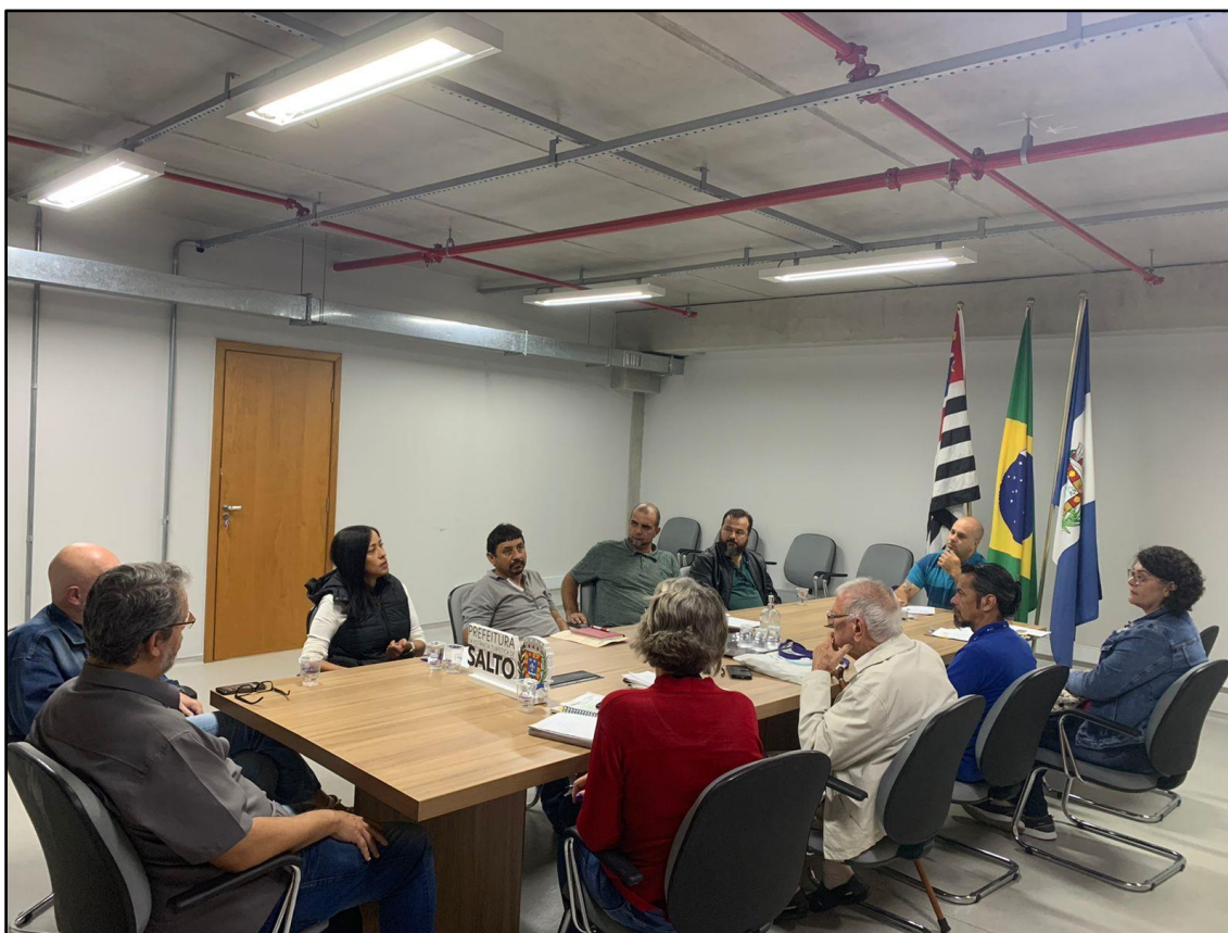
Figura 5 - Registro da Reunião Ordinária do COMDEMA de 30 de maio de 2022.