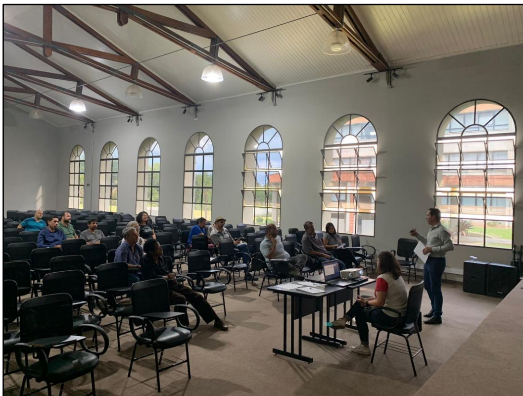
Figura 11 - Registro da Reunião Ordinária do COMDEMA de 29 de novembro de 2022.