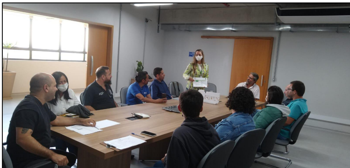
Figura 6 - Registro da Reunião Ordinária do COMDEMA de 27 de junho de 2022.