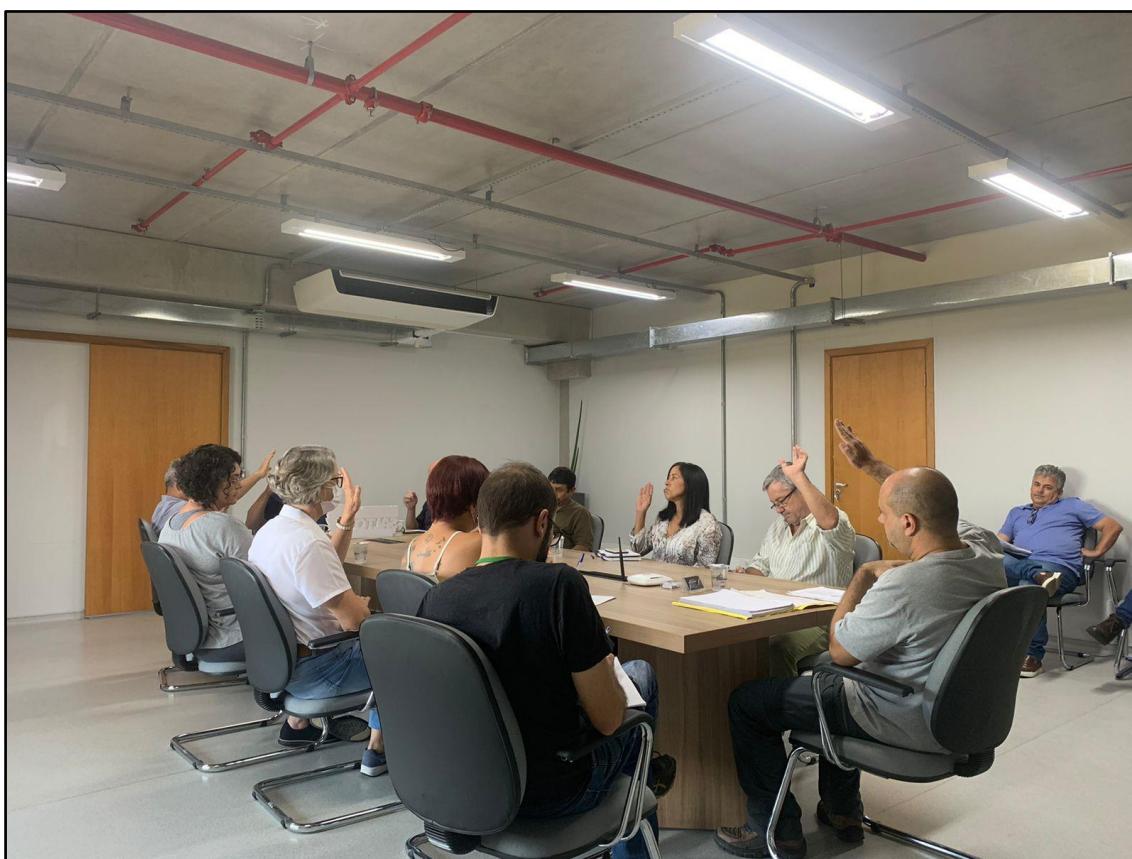
Figura 4 - Registro da Reunião Ordinária do COMDEMA de 25 de abril de 2022.