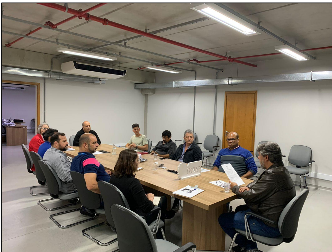
Figura 9 - Registro da Reunião Ordinária do COMDEMA de 26 de setembro de 2022.