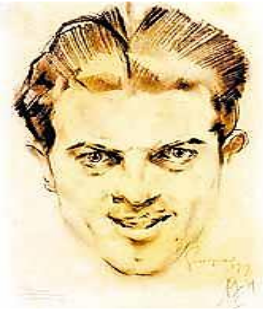
CARVALHO, Flávio. Autorretrato . 1965. 1 óleo sobre tela, 90 cm x 67 cm. Museu de Arte Moderna de São Paulo.

1- Analise as imagens e responda às questões: