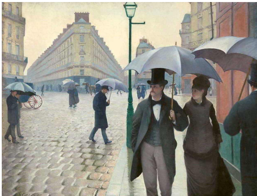
GUSTAVE CAILLEBOTTE E RENÉ MAGRITTE