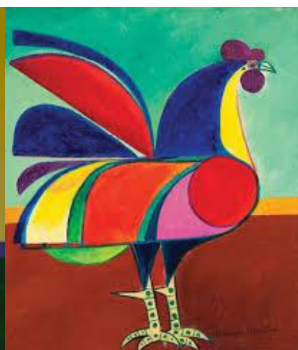
O GALO (1977)