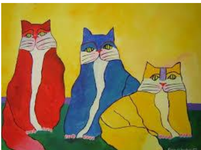
FAMÍLIA DE GATOS (2003)

FOI UM DOS PINTORES MAIS IMPORTANTES DO BRASIL. EM SUAS OBRAS CHEIAS DE CORES, ELE VALORIZAVA AS PAISAGENS DE NOSSO PAÍS E TAMBÉM PINTOU VÁRIOS ANIMAIS. VEJA: