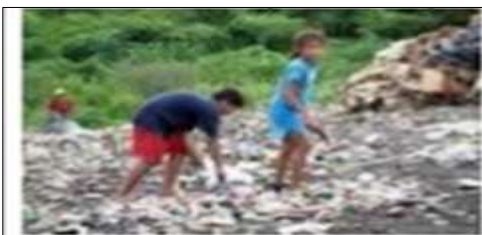
Famílias vivendo em lixões.