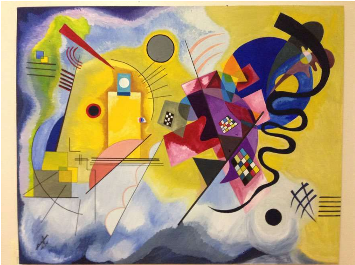
Amarelo-Vermelho-Azul - Wassily Kandinsky

EXPRESSIVIDADE ARTÍSTICA Wassily Kandinsky (Abstração/ Pintura)