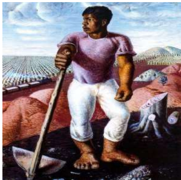
FIGURA 1 - UMA DAS MAIS EMBLEMÁTICAS OBRAS DE CÂNDIDO PORTINARI É “ O LAVRADOR DE CAFÉ ”. PRODUZIDA EM 1934 COM TINTA A ÓLEO, A TELA DE 100 X 81 CM FAZ PARTE DO ACERVO DO MASP.

TEMPOS, SENDO O PINTOR BRASILEIRO A ALCANÇAR MAIOR PROJEÇÃO INTERNACIONAL.