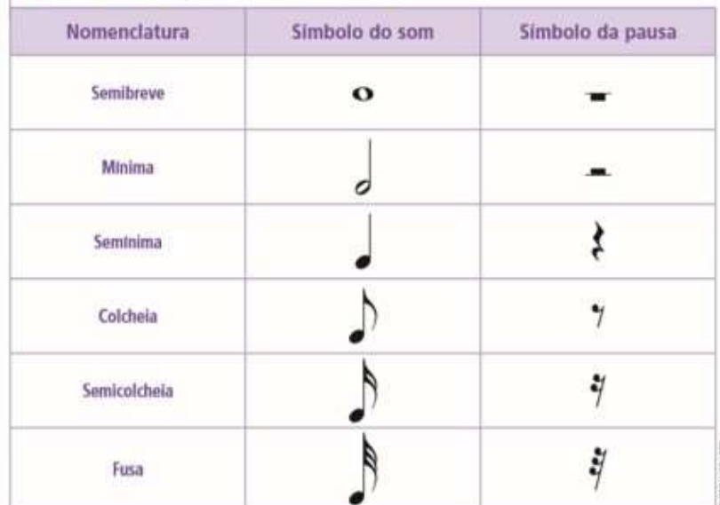
Figuras rítmicas para a escrita musical