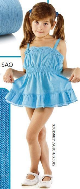
O TECIDO É USADO PARA FAZER O VESTIDO.

A. NUMERE A SEQUÊNCIA DAS TRANSFORMAÇÕES QUE OCORREM DESDE A COLHEITA DA FLOR DO ALGODOEIRO.