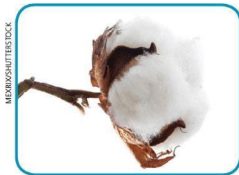
A FLOR DO ALGODOEIRO É COLHIDA.

HÁ MATERIAIS QUE PASSAM POR MUITAS TRANSFORMAÇÕES DESDE QUE SÃO RETIRADOS DA NATUREZA. VEJA O EXEMPLO DO ALGODÃO, QUE É UTILIZADO PARA A PRODUÇÃO DE TECIDOS.