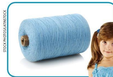
AS FIBRAS DA FLOR SÃO FIADAS E TINGIDAS.