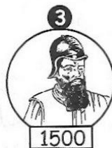
Pedro Álvares Cabral