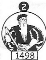
Vasco da Gama