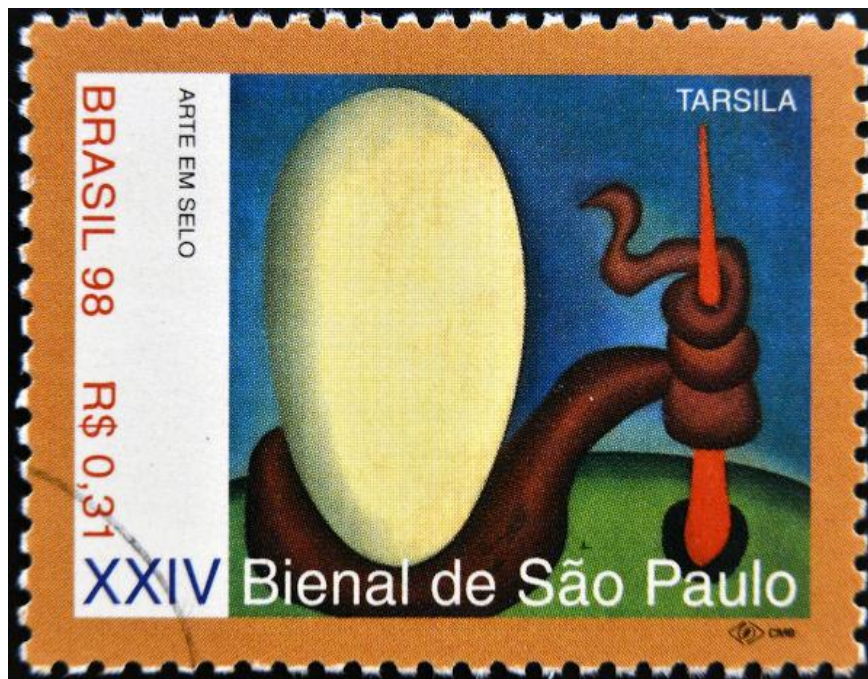
Selo da XXIV Bienal de São Paulo

SUGESTÃO: Leia também: Dadaísmo – a vanguarda que era contra os valores estéticos tradicionais