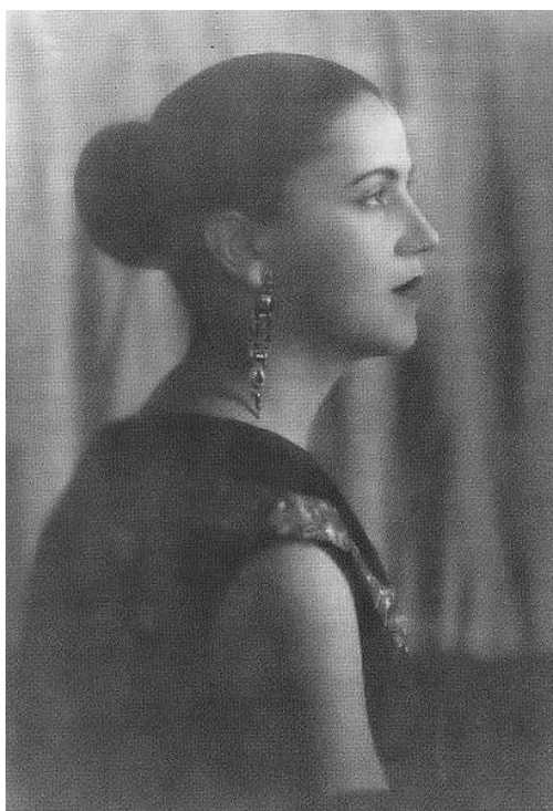
Tarsila do Amaral, possivelmente em 1925.

A pintora Tarsila do Amaral nasceu em 1º de setembro de 1886, em Capivari, no estado de São Paulo, e morreu em 17 de janeiro de 1973, na cidade de São Paulo. Sua obra apresenta paisagens rurais e urbanas brasileiras, além de elementos da fauna, flora e folclore do país. Seu primeiro quadro – Sagrado coração de Jesus – foi feito em 1904, em Barcelona, quando a artista estudava na Espanha. De 1920 a 1922, estudou na Académie Julien, em Paris. Assim, não participou da Semana de Arte Moderna de 1922, já que estava na França quando o evento ocorreu. A pintora, portanto, teve uma formação acadêmica antes de aderir ao Modernismo.