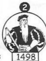
Vasco da Gama