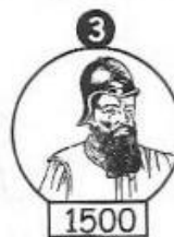
Pedro Álvares Cabral