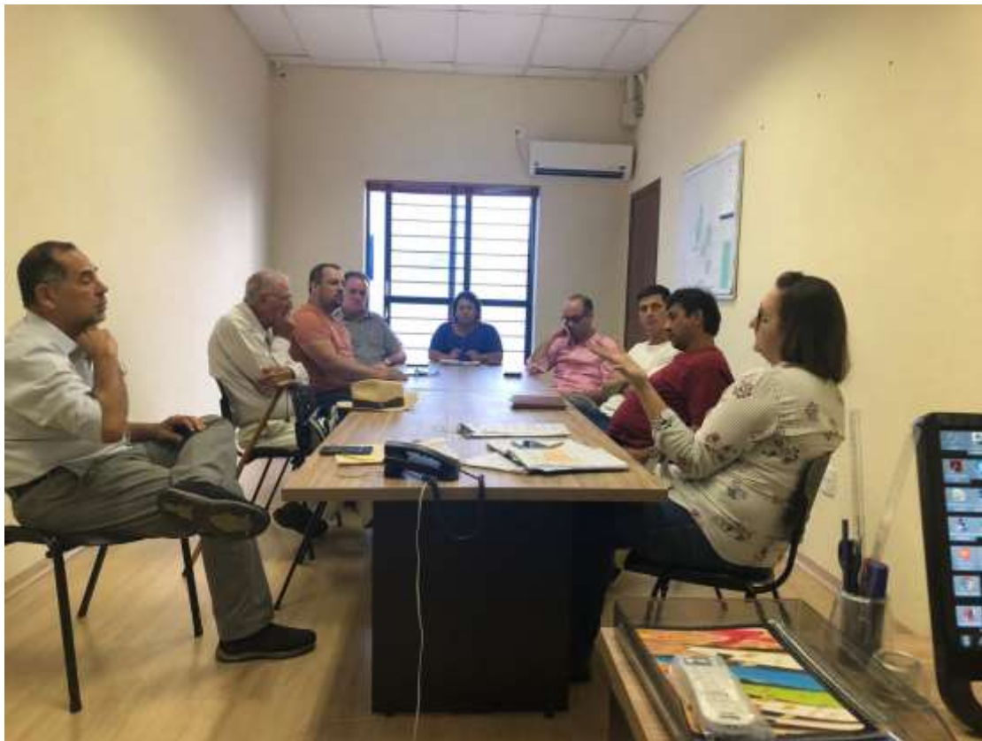
Foto 05: registro da reunião do COMDEMA ocorrida no dia 29 de abril de 2019.

Reunião realizada no dia 27 de maio de 2019 às 15 horas na sala de reunião do SAAE , onde participaram os seguintes segmentos: SMMA, SAAE, Sec. Educação, Sec. Saúde, Sec. De Obras e Serviços Públicos, Associação de Moradores, Instituição Ambientalista, Sindicato Patronal, Entidades sem fins lucrativos e Sec. Negócios Jurídicos.