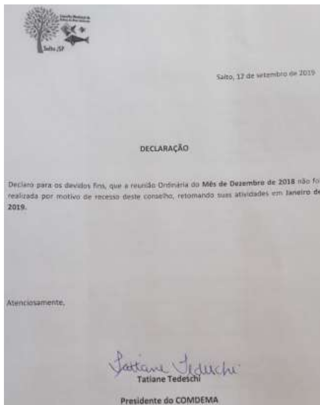
Print da Declaração de recesso assinada pela Presidente do COMDEMA

As reuniões acontecem mensalmente conforme regulamentado pelo seu regimento interno (anexo na pasta). Pontualmente nos meses de dezembro não há reuniões, por ser o período de recesso do Conselho , decisão que partiu dos próprios membros, e aprovada por unanimidade, e conforme declaração assinada pela presidente do COMDEMA (print abaixo).