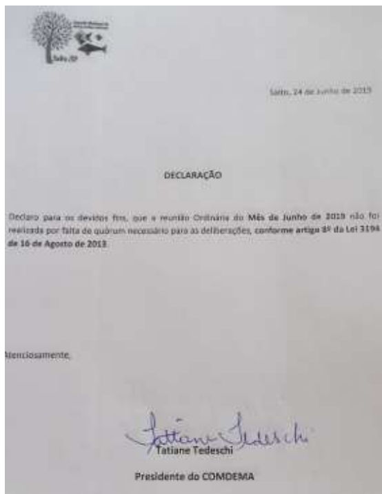
Prints das declarações de falta de quórum assinadas pela Presidente do COMDEMA