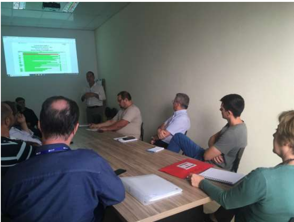
Foto 09: registro da reunião do COMDEMA ocorrida no dia 23 de setembro de 2019.