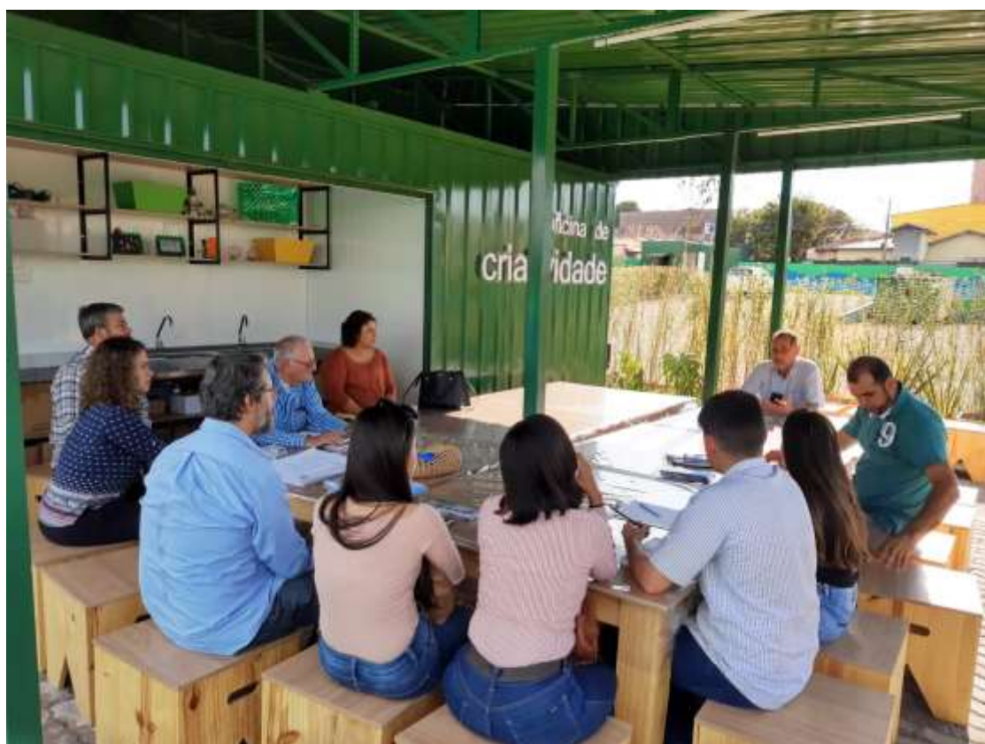
Foto 08: registro da reunião do COMDEMA ocorrida no dia 26 de agosto de 2019.

Reunião realizada no dia 23 de setembro de 2019 às 15 horas no SAAE , onde participaram os seguintes segmentos: SMMA, Sec. Desenvolvimento Econômico, Trabalho e Turismo, Sec. Negócios Jurídicos, SAAE, Sec. Educação, Sec. Saúde, Sec. De Obras e Serviços Públicos, Instituição Ambientalista, Sindicato Patronal, Entidades sem fins lucrativos, Associação de Moradores e INEVAT.