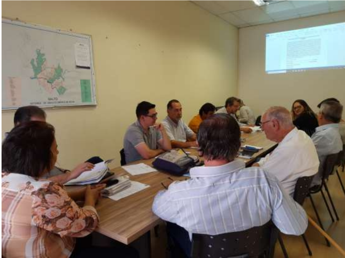
Foto 07: registro da reunião do COMDEMA ocorrida no dia 29 de julho de 2019.

Reunião realizada no dia 26 de agosto de 2019 às 15 horas no Ecoponto 09 , onde participaram os seguintes segmentos: SMMA, Sec. Desenvolvimento Econômico e Trabalho, Sec. Desenvolvimento Urbano, Sec. Negócios Jurídicos, SAAE, Sec. Educação, Sec. Saúde, Sec. De Obras e Serviços Públicos, Instituição Ambientalista, -Sindicato Patronal, Entidades sem fins lucrativos e Instituição de Classes.