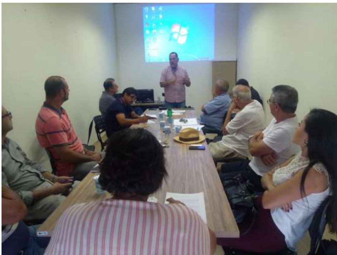
Foto 03: registro da reunião do COMDEMA ocorrida no dia 25 de fevereiro de 2019.