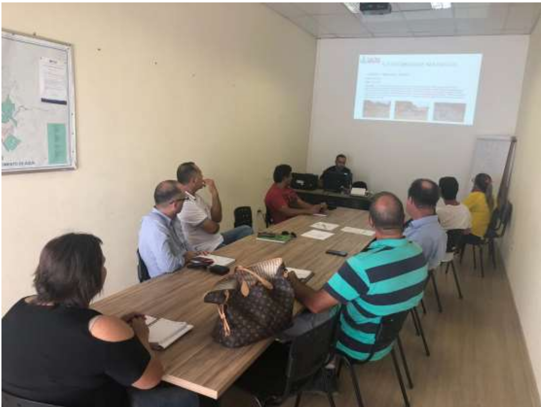
Foto 02: registro da reunião do COMDEMA ocorrida no dia 28 de janeiro de 2019.

Reunião realizada no dia 25 de fevereiro de 2019 às 15 horas na sala de reunião do SAAE , onde participaram os seguintes segmentos: SMMA, Sec. Desenvolvimento Urbano, SAAE, Sec. Educação, Sec. Saúde, Sec. Desenvolvimento Econômico e Trabalho, Sec. Obras e Serviços Públicos, Sindicato Patronal, Instituição Ambientalista e Associação de Moradores.