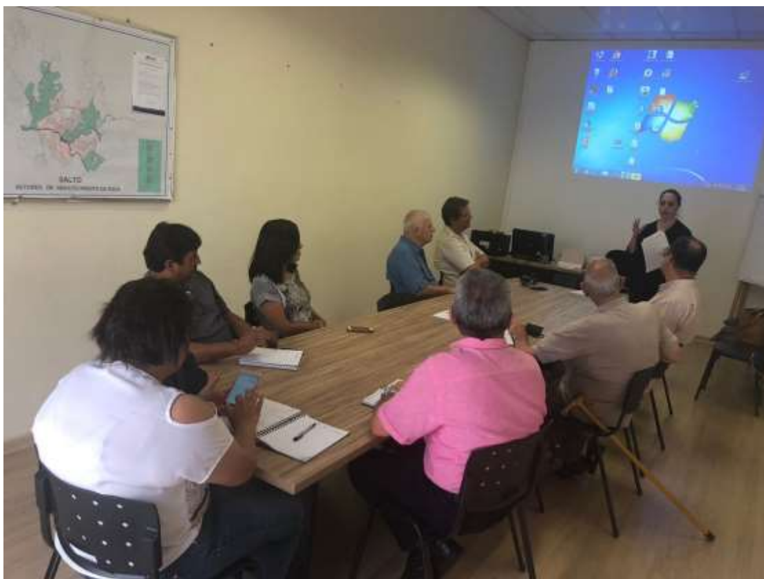
Foto 01: registro da reunião do COMDEMA ocorrida no dia 31 de outubro de 2018.

Reunião realizada no dia 28 de janeiro de 2019 às 15 horas na sala de reunião do SAAE , onde participaram os seguintes segmentos: SMMA, SAAE, Sec. Educação, Sec. Saúde, Sec. Desenvolvimento Econômico e Trabalho, Sec. Obras e Serviços Públicos, Sec. Negócios Jurídicos, Instituição de Classe e Associação de Moradores.