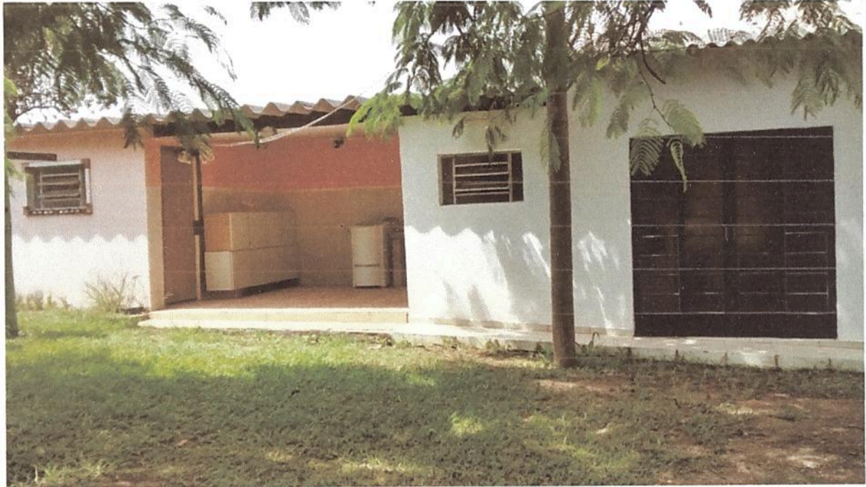
Imagem 3. Lavanderia doméstica e industrial da Associação Casa Naim Salto.