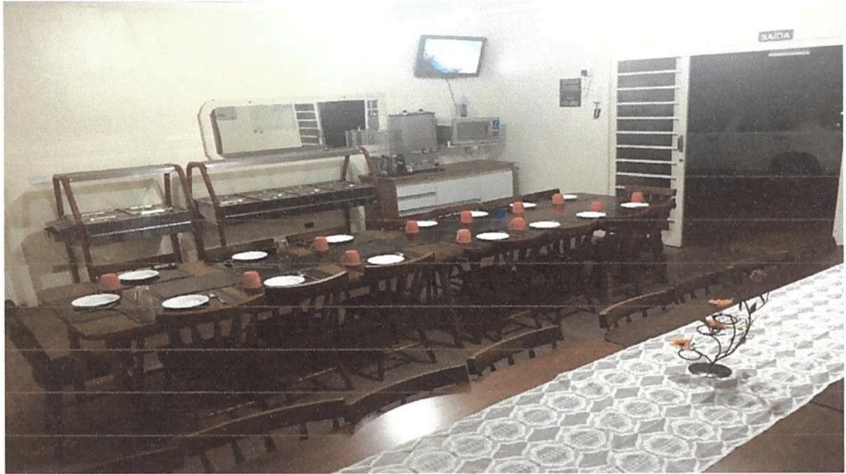
Imagem 1. Refeitório Associação Casa Naim Salto.