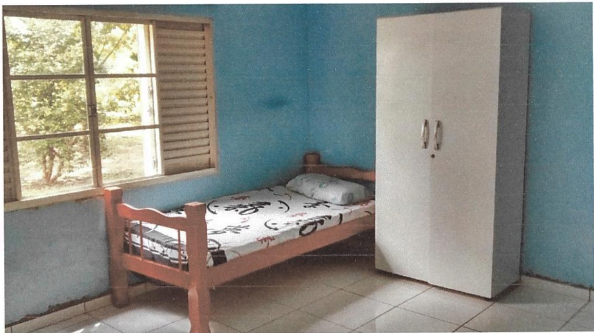
Imagem 4. Dormitório masculino e/ ou feminino da Associação Casa Naim Salto.