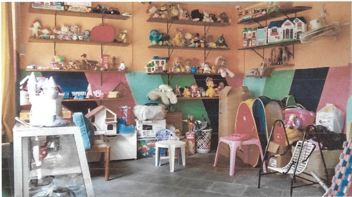
Imagem 2. Brinquedoteca da Associação Casa Naim Salto.