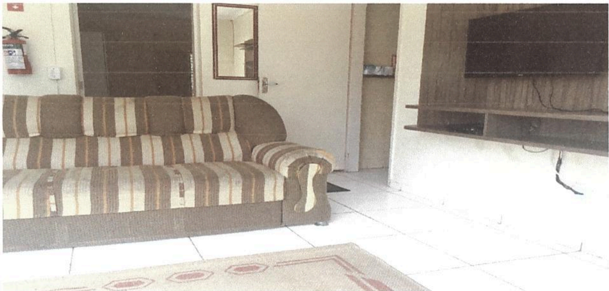
Imagem 8. Sala de TV do Dormitório masculino e/ ou feminino da Associação Casa Naim Salto.