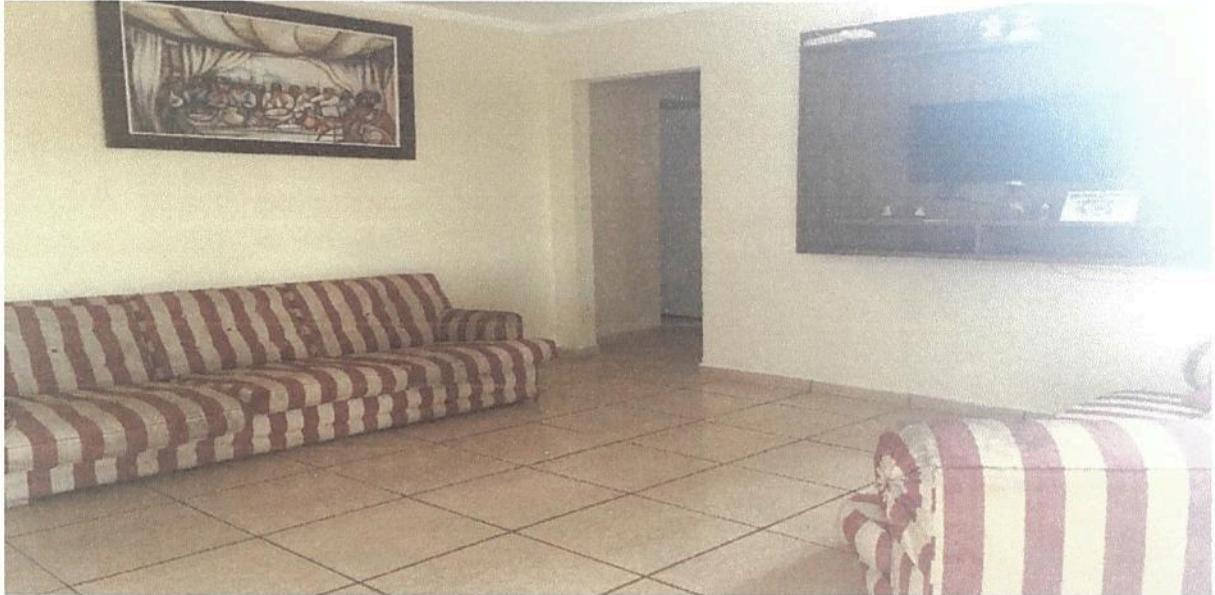
Imagem 7. Sala de TV do Dormitório masculino e/ ou feminino da Associação Casa Naim Salto.