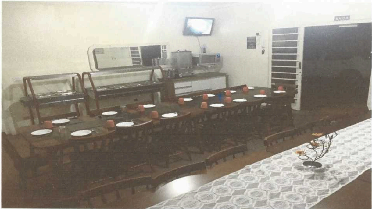
Imagem 1. Refeitório Associação Casa Naim Salto.