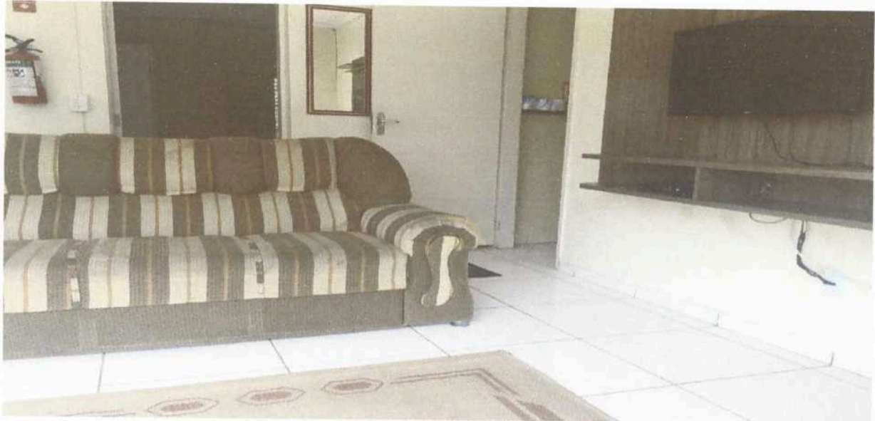
Imagem 7. Sala de TV do Dormitório masculino e/ ou feminino da Associação Casa Naim Salto.