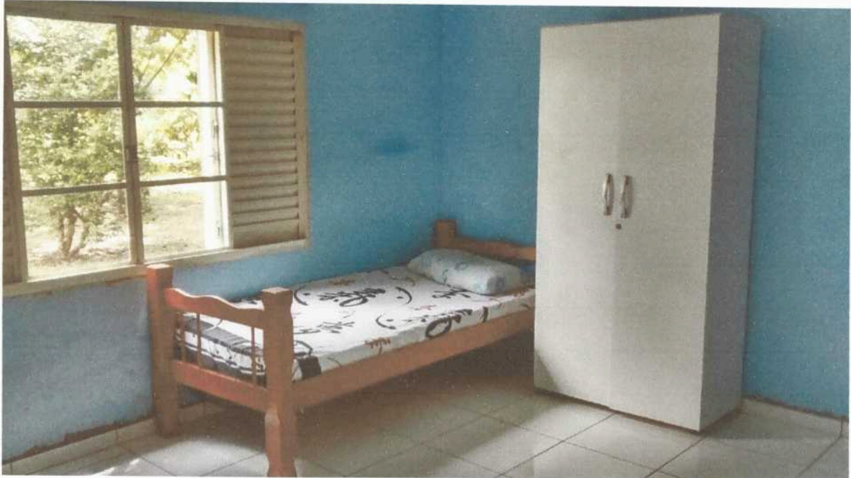
Imagem 3. Dormitório masculino e/ ou feminino da Associação Casa Naim Salto.