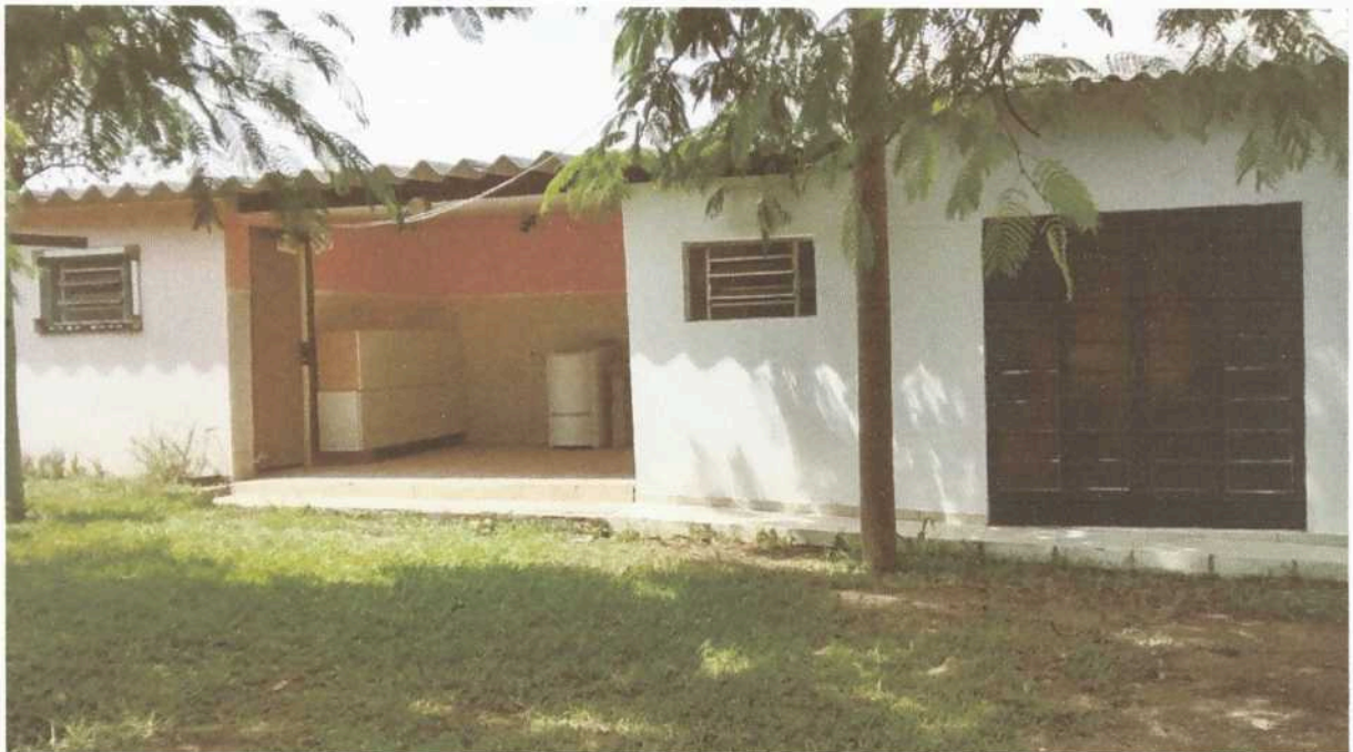
Imagem 2. Lavanderia Doméstica e Industrial da Associação Casa Naim Salto.