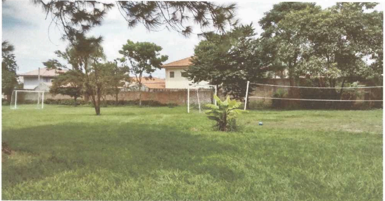
Imagem 5. Área externa e de lazer da Associação Casa Naim Salto.