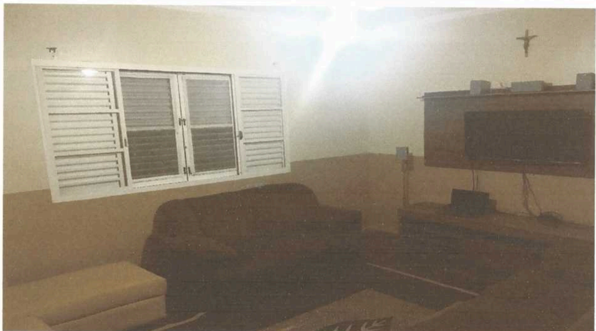
Imagem 8. Sala de TV da casa sede da Associação Casa Naim Salto.