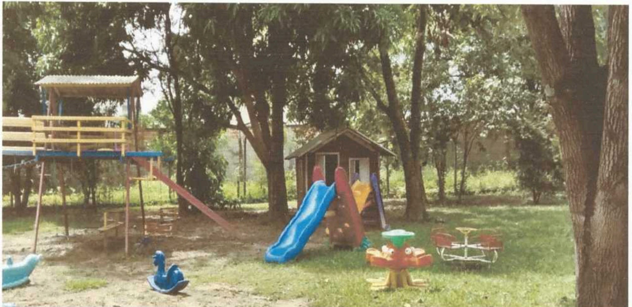
Imagem 4. Área externa e de lazer da Associação Casa Naim Salto.