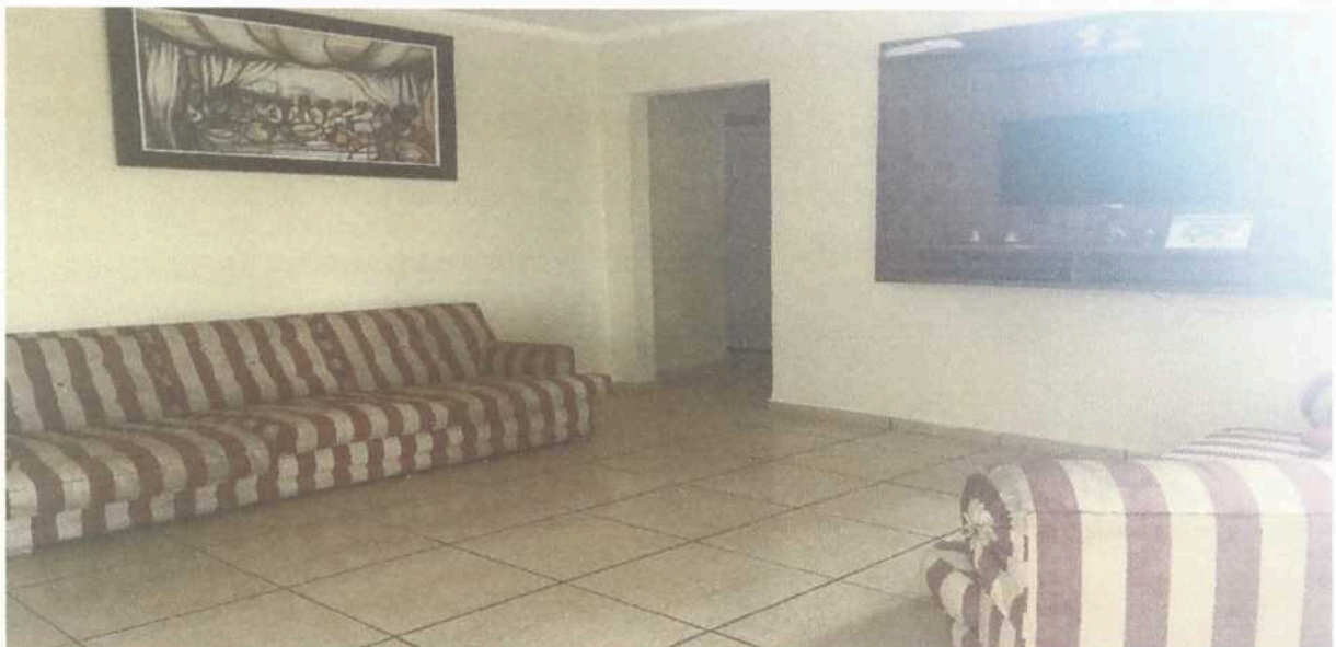
Imagem 6. Sala de TV do Dormitório masculino e/ ou feminino da Associação Casa Naim Salto.