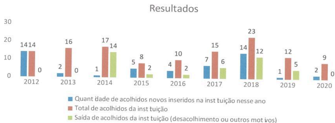
Gráfico1. Resultados gerais da Instituição.