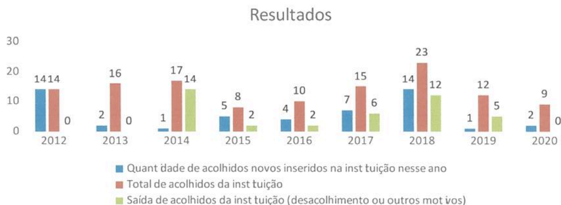
Gráfico1. Resultados gerais da Instituição.