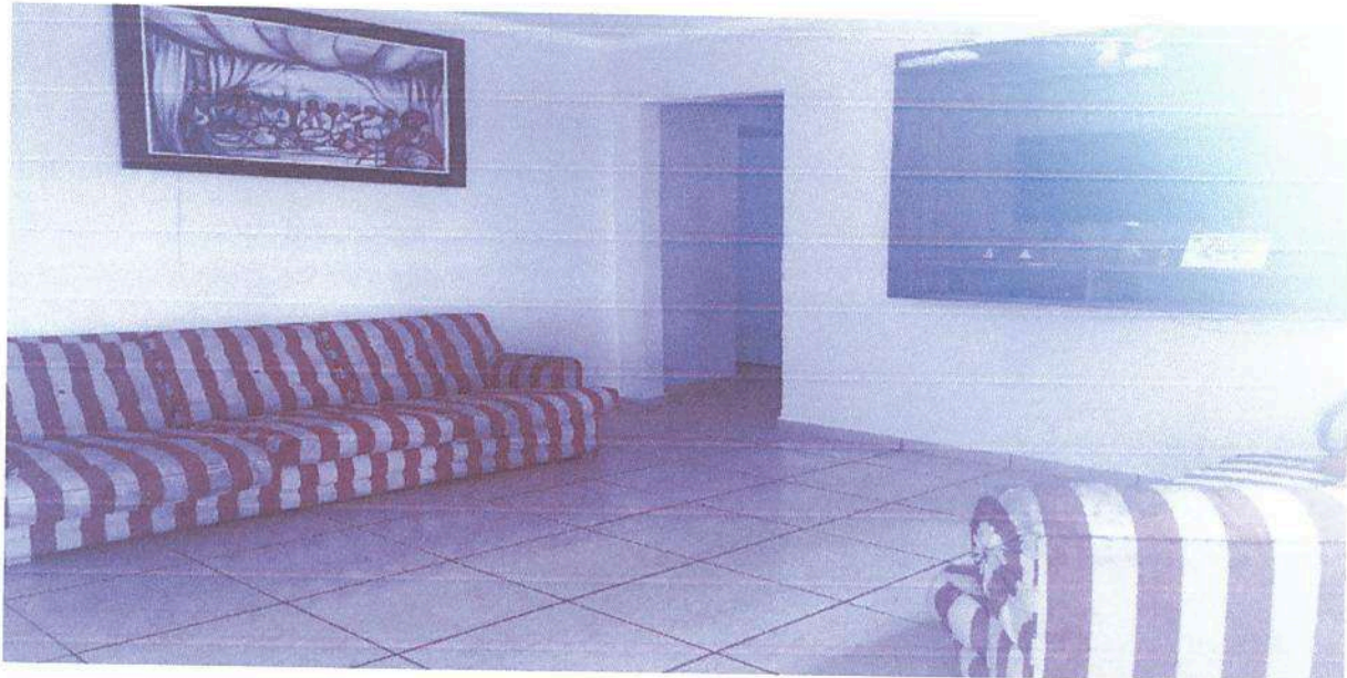
Imagem 7. Sala de TV do Dormitório masculino e/ ou feminino da Associação Casa Naim Salto.