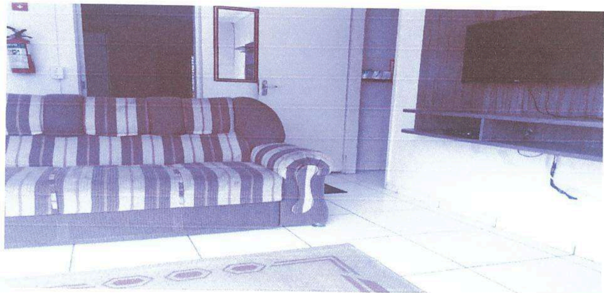
Imagem 8. Sala de TV do Dormitório masculino e/ ou feminino da Associação Casa Naim Salto.