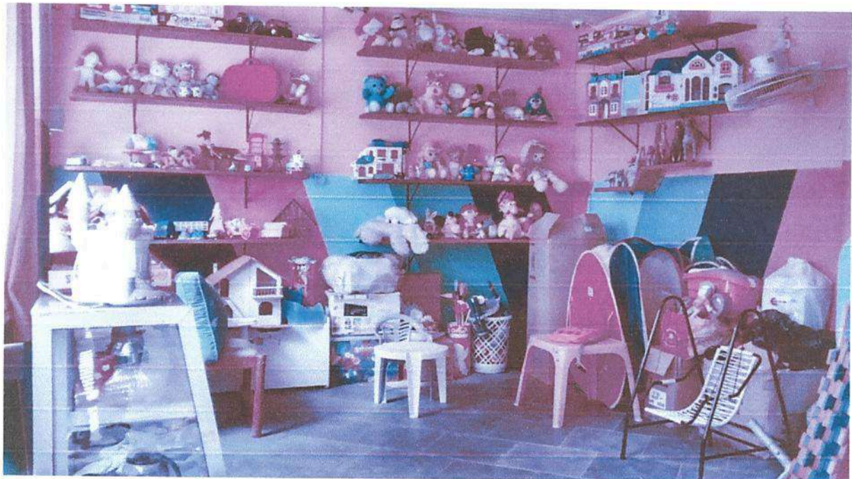
Imagem 2. Brinquedoteca da Associação Casa Naim Salto.