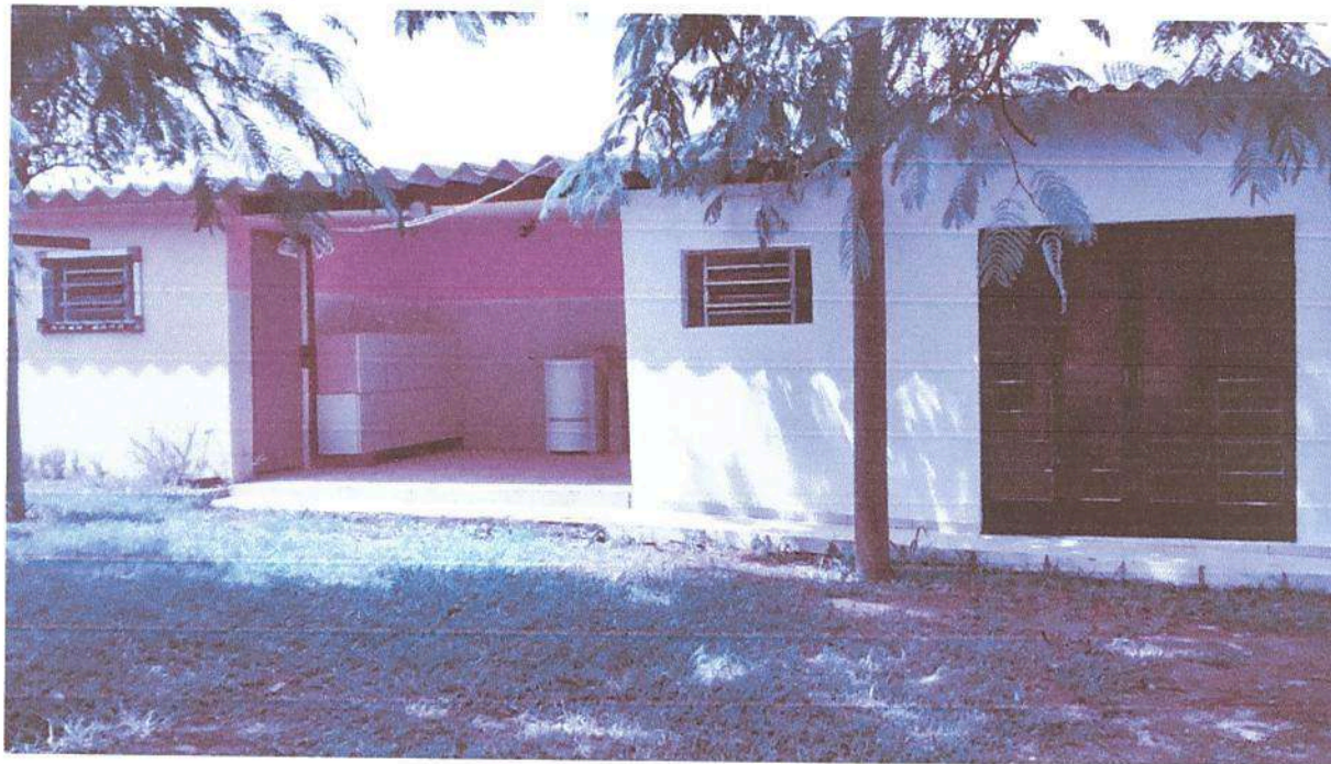
Imagem 3. Lavanderia doméstica e industrial da Associação Casa Naim Salto.