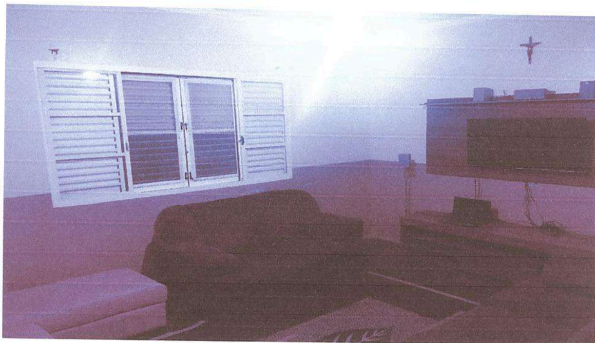
Imagem 9. Sala de TV da casa sede da Associação Casa Naim Salto.