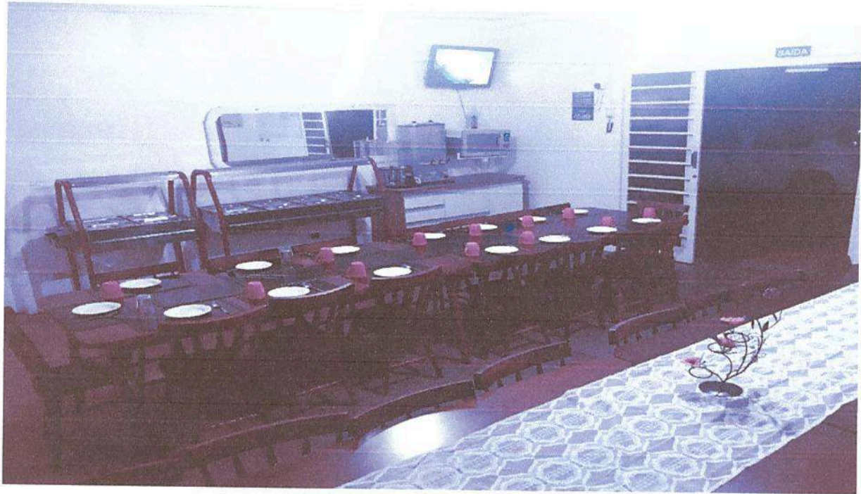
Imagem 1. Refeitório Associação Casa Naim Salto.