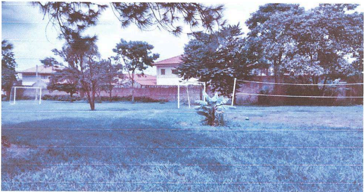
Imagem 6. Área externa e de lazer da Associação Casa Naim Salto.