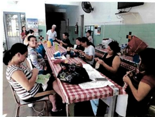
Oficina do Saber