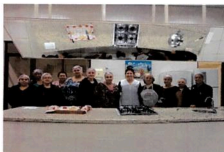
Curso de pães