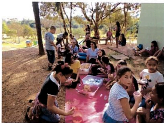
Passeio Parque do Lago

CERTIFICADO DE ENTIDADES BENEFICENTES DE ASSISTENCIA SOCIAL – PORTARIA 142 DE 24/10/2016