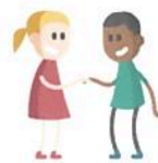
C. Acompanhamento da criança e/ ou adolescente