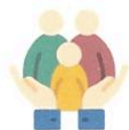
D. Estudo e acompanhamento familiar