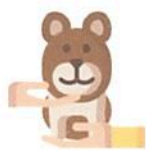
A. Recepção e acolhimento da criança e/ ou adolescente