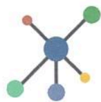
E. Articulação com a rede de apoio