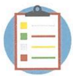
B. Construção do Plano de Atendimento Individual