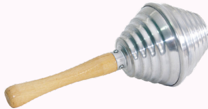
Instrumento da bandinha