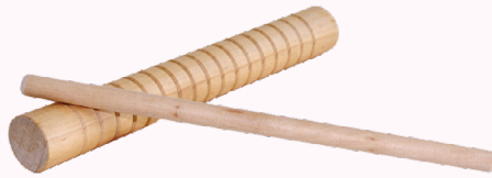
Instrumento da bandinha