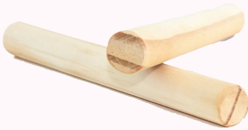
Instrumento da bandinha