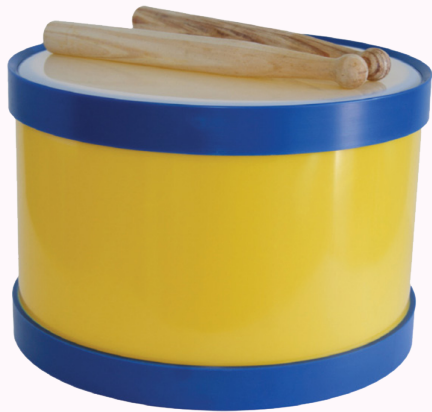
Instrumento da bandinha