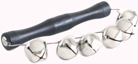
Instrumento da bandinha