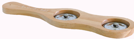
Instrumento da bandinha